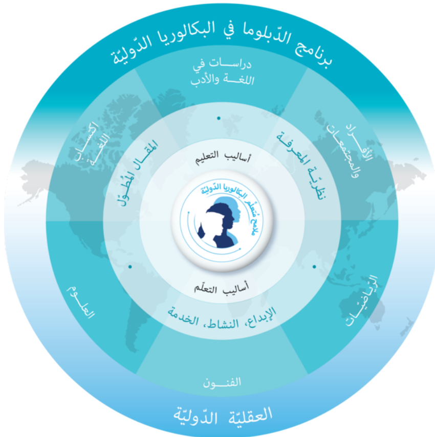
نموذج برنامج الدبلوما