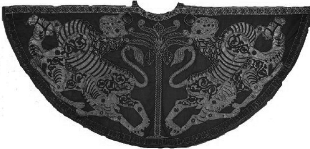
Imagen extraída de: The Norman Kingdom of Sicily , (El reino normando de Sicilia), D. J. A. Matthew (1992).

Capa ceremonial, ricamente bordada en seda y confeccionada en un taller real para Roger II poco después de su coronación. La inscripción árabe del borde honra y aprueba su gobierno, deseándole lo mejor para el futuro. La imagen en la capa muestra leones atacando a camellos.