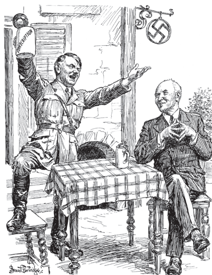
PROSIT! HERR HITLER. "THE MORE WE ARM TOGETHER THE PEACEFULER WE'LL BE!" SIR JOHN SIMON. "WELL—ER—UP TO A CERTAIN POINT—AND IN CERTAIN CASES—PROVISIONALLY—PERHAPS."

Herr Hitler : « Plus nous nous armons ensemble, plus nous serons en paix ! » Sir John Simon : « Et bien – euh – jusqu'à un certain point – et dans certains cas – provisoirement – peut-être. »