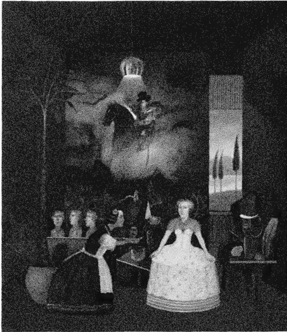
Tráiganme la cabeza de Diego Velázquez