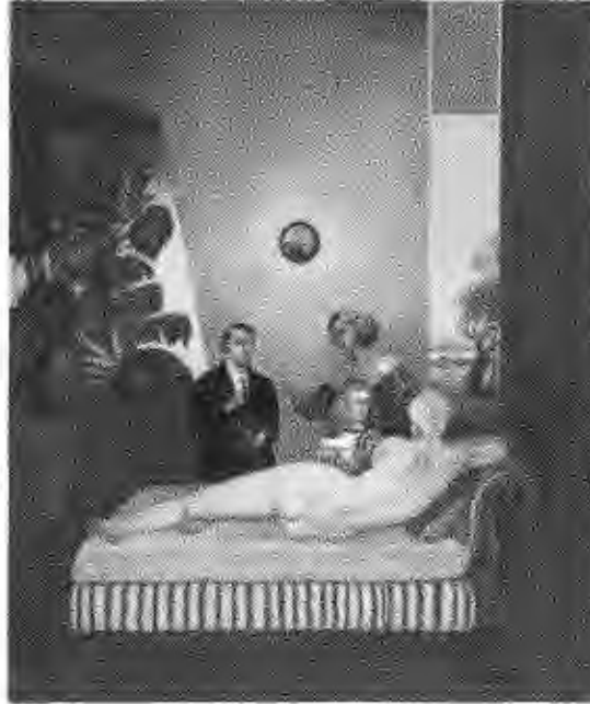
El error de la cortesana