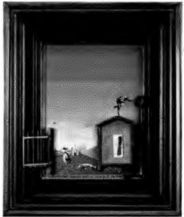
Figure 2 - Max Ernst - Deux enfants menacés par un rossignol, créée en 1924. Huile sur toile avec éléments en bois 4

Max Ernst était aussi un écrivain, sculpteur. Il mélangeait souvent peinture et littérature 2. Cette peinture de Max Ernst créée en 1924 est une de ces mélanges. Elle est composée de peinture mais aussi d'objets collés sur la toile. Ces objets sont collés comme un portillon ouvert, Max Ernst nous offre une entrée dans le tableau. Cette peinture est une de ces œuvres surréalistes, grâce au collage d'objets. Cette œuvre lança elle aussi le mouvement surréaliste, avec l'œuvre de André Breton: Le manifeste 3.