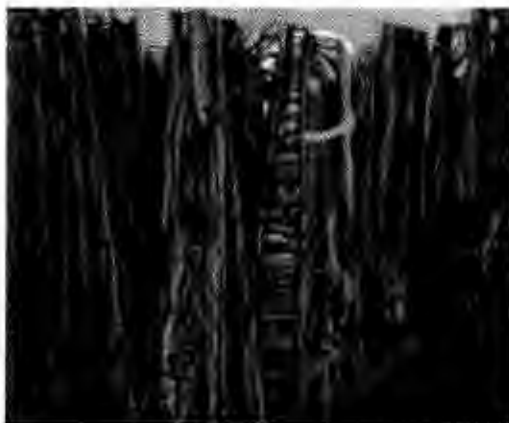
Figure 7 - Max Ernst, La forêt pétrifiée. 1927 4

Le grattage est une technique inventé en 1927, qui consiste à gratter la peinture qui n'est pas encore sèche avec un bout de matériaux pour créer une texture. Le grattage peut aussi permettre à la création d'un nouveau dessin dans la peinture 3. Max Ernst a beaucoup utilisé cette techniques dans ses tableaux tel que: