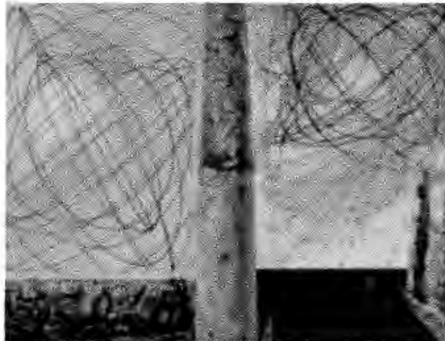
Figure 7 - Max Ernst, la planète affolée. 1942 3

Après que Max Ernst ait été exilé aux Etats Unis, l'artiste a avancé la recherche de la technique de l'oscillation. La technique consiste à remplir une boîte percée de peinture, pour que la peinture passe par les trous et tombe sur la toile pour créer un effet d'espace, de planètes etc... La boîte est suspendu, le mouvement est créé par l'artiste. Le seul problème de cette technique est le manque de contrôle, car la peinture coule de manière incontrôlée 2 .