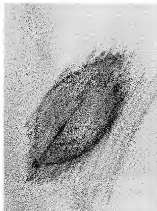
Figure 4: Frottage 2