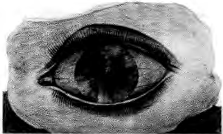
Figure 6 - Max Ernst, la roue de la lumière (Frottage) 2

Une oeuvre de Max Ernst faite entièrement avec la technique du frottage. Ceci nous donne un aperçu de la recherche intense de l'artiste pour trouver toutes ces textures 1.