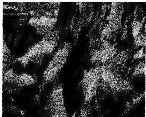
Figure 8 - Jean-Paul Charles, dégel. 2012 4