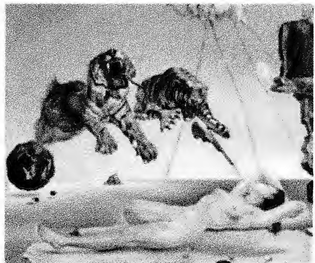
Figure 1: Toile de Salvador Dali 2 Gala et les tigres, créée en 1981

René Magritte, lui aussi en était un, peignant ses toiles dans son salon sans modèle pour laisser son imagination créer ces images. Bien sûr, Max Ernst était un des premiers peintres surréalistes, ayant contribué à la création de l'art surréaliste grâce à ces techniques tel que le grattage, le frottage et la décalcomanie. La plupart des artistes surréalistes étaient originaire d'Europe. Ils se sont tous rendus à Paris (Capitale de l'art dans l'entre-deux-guerres) pour montrer au monde l'inconscient de leurs réalités. Tous ces artistes étaient engagés politiquement et socialement, voulant la liberté d'expression et le rêve.