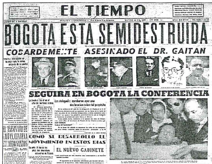
Imagen 1: Fotos periodico El Tiempo en la portada Miércoles 21 de Abril de 1948 (Sierra, 1948, pág. 1)

En este siglo entran a jugar varios factores que para la identidad del país y de la región cundiboyacense agravan la situación cultural. En primera instancia llegan en los años 50 una serie de sucesos sangüinarios que en su mayoría tienen lugar en la ciudad de Bogotá.