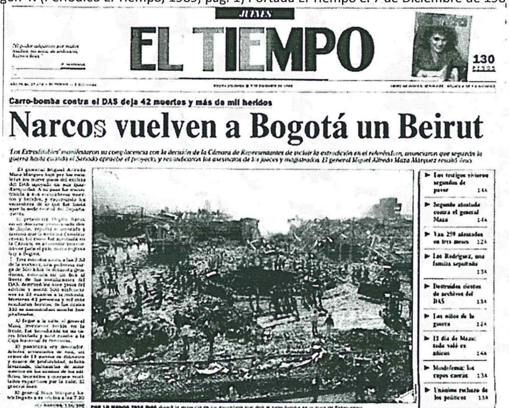
Imagen 4: (Periodico El Tiempo, 1989, pág. 1) Portada El Tiempo el 7 de Diciembre de 1989.

En la imagen además de presentarse en primera plana la fotografía más devastadora del atentado del carro-bomba a las instalaciones del Departamento Administrativo de Seguridad (DAS) en la ciudad de Bogotá el 6 de Diciembre de 1989, a las 07:30 de la mañana. También, se impone allí un encabezado que sin mayor esfuerzo logra llamar la atención del lector. Pero ¿En verdad este título es el apropiado para una sociedad que a lo largo de una década fue completamente devastada por atentados parecidos?