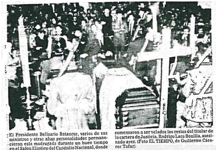
Imagen 3: Funeral del Ministro Lara Bonilla. (Cáceres, 1984, pág. 9)

El inicio de este fenómeno comenzó con el asesinato del ministro de justicia, Rodrigo Lara Bonilla. Situación ilustrada en la siguiente fotografía, donde las cruces