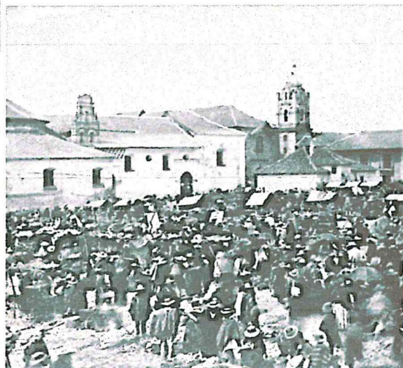
(Anónimo,1870, Museo Nacional de Colombia)

ambos lugares registros fotográficos donde se muestra la cantidad de personas que luchaban por obtener los mejores productos, ya que estos insumos hacían parte de la cultura de la sociedad de bajos recursos económicos.