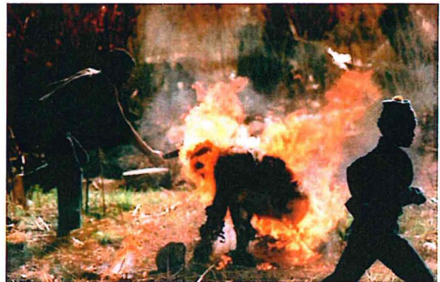
Imagen 5: 'Zulu' quemándose (Marinovich, 1991)

Este efecto de los medios de comunicación se ilustra en la película "El club del BangBang" (Silver, 2010) basada en la obra de dos reporteros gráficos que sobrevivieron a la guerra civil en Sudáfrica. Cuando en una escena uno de los reporteros que integraban el Club, Greg Marinovich ganador de un premio Pulitzer, toma la fotografía de un 'Zulu' quemándose vivo mientras era golpeado por enemigos.