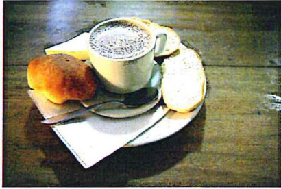
Imagen 9: Chocolate Santaferenseño. (Friendofsnails, 2010)

Por otro lado, de manera sincronizada, se van construyendo tradiciones que hoy en día hacen parte de un bogotano y campesino cundiboyacense del común. Primero, nacen las onces con chocolate Santaferenseño, almojábanas, arepas y pan