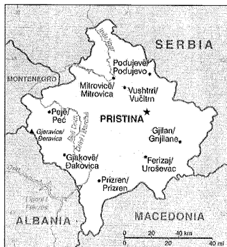
Anexo 3: Mapa de la República de Kosovo